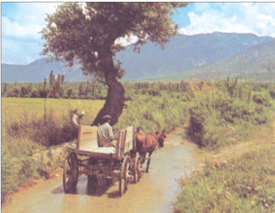
Kolosse városa a termékeny Lükosz-völgyben helyezkedett el, Laodicea és Hierapolisz közelében. A vidék lakosai hajlottak a panteista és gnosztikus eszmék felé, ezért Pál apostol éppen ezektől a tévutakatól óvta őket. (illusztr.: A Biblia kézikönyve.)

Epafrász az Úr áldott eszköze volt és Pál apostol hűséges szolgatársa. Valamennyiünk számára igazi példakép. A Vezérfonal szerint március első vasárnapján befejezzük a kolosséi levél tanulmányozását.